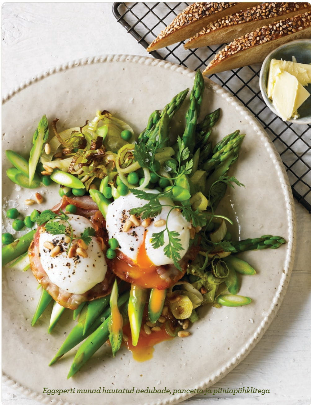
Eggsperti munad hautatud aedubade, pancetta ja piiniapähkliatega