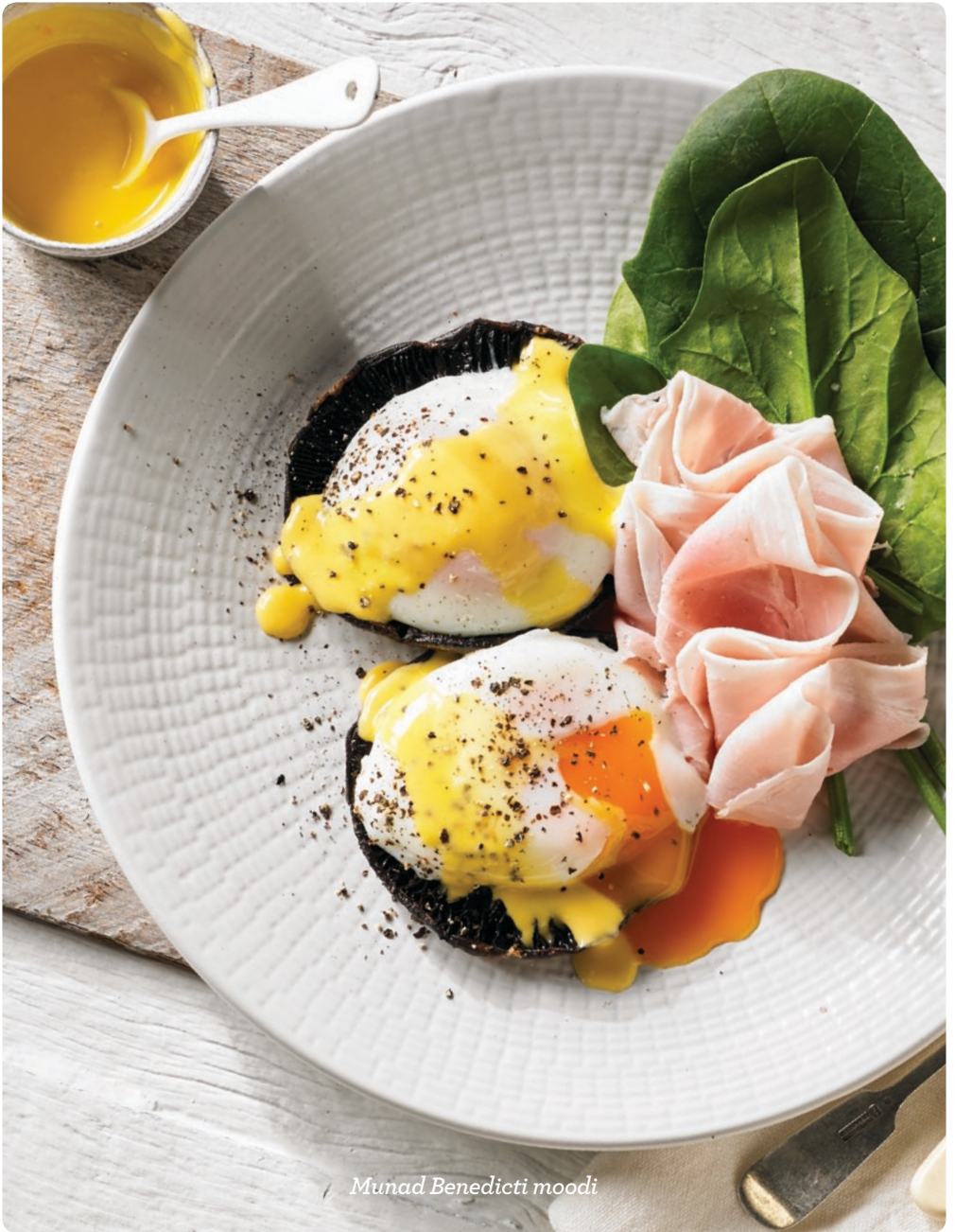
Munad Benedicti moodi