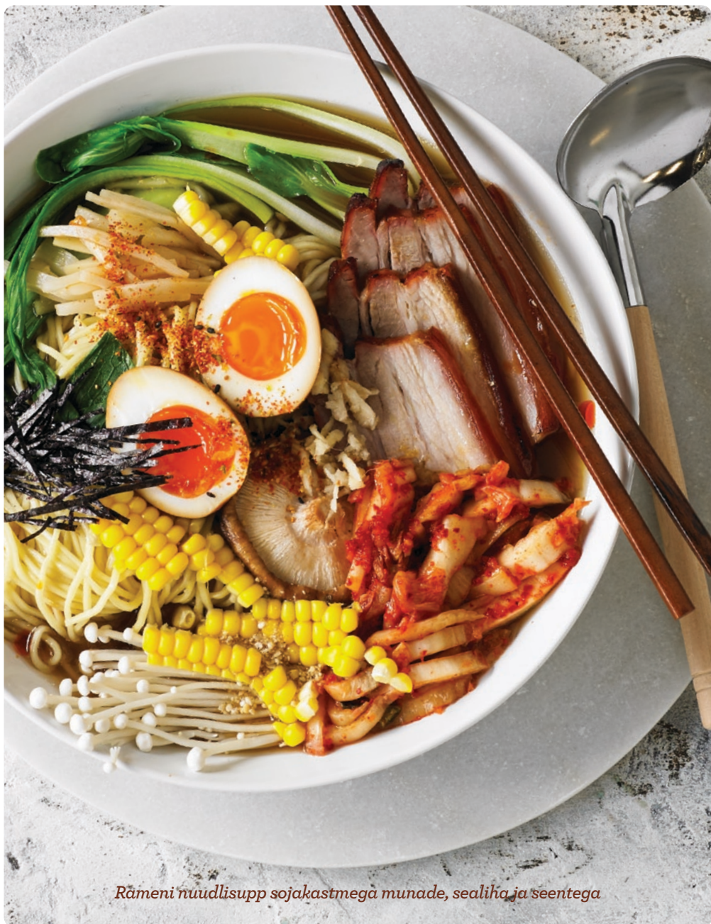
Rämeni nuudlisupp sojakastmega munade, sealihaj ja seentega