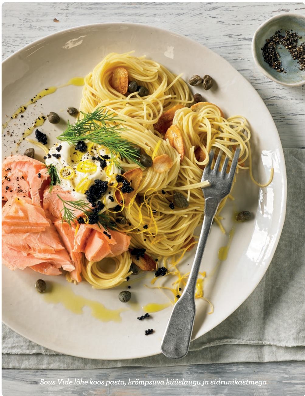
Sous Vide lõhe koos pasta, krõmpsuva küüslaugu ja sidrunikastmega