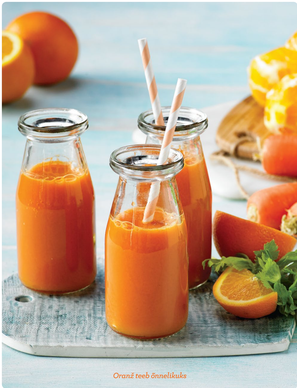
Oranž teeb õnnelikuks