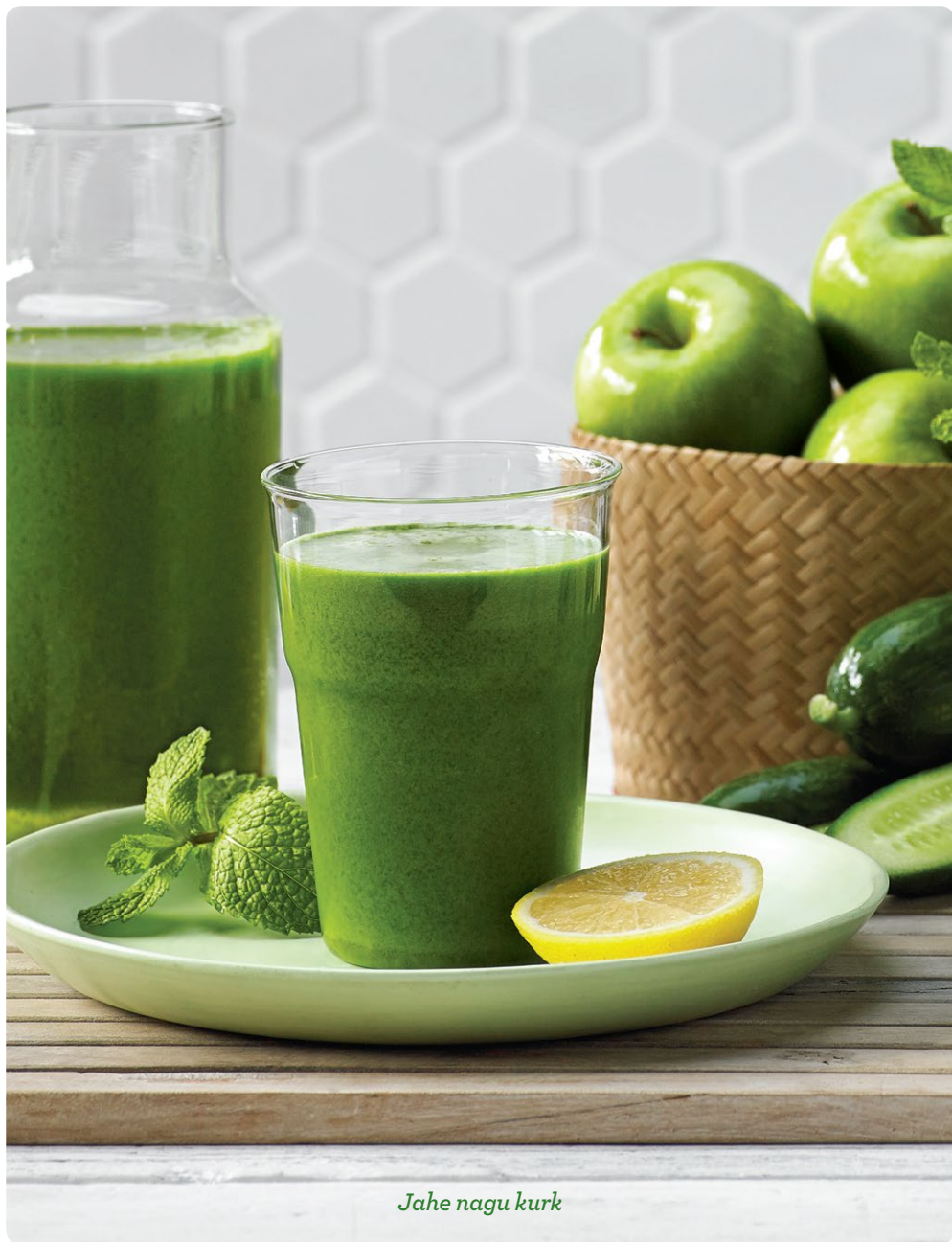
Jahe nagu kurk