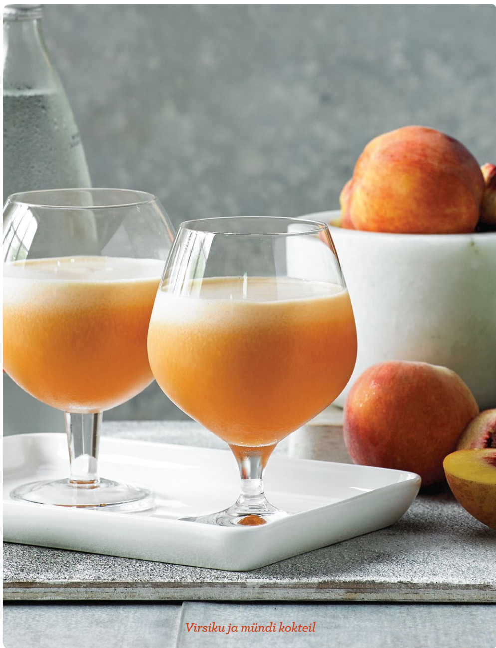
Virsi ja mündi kokteil