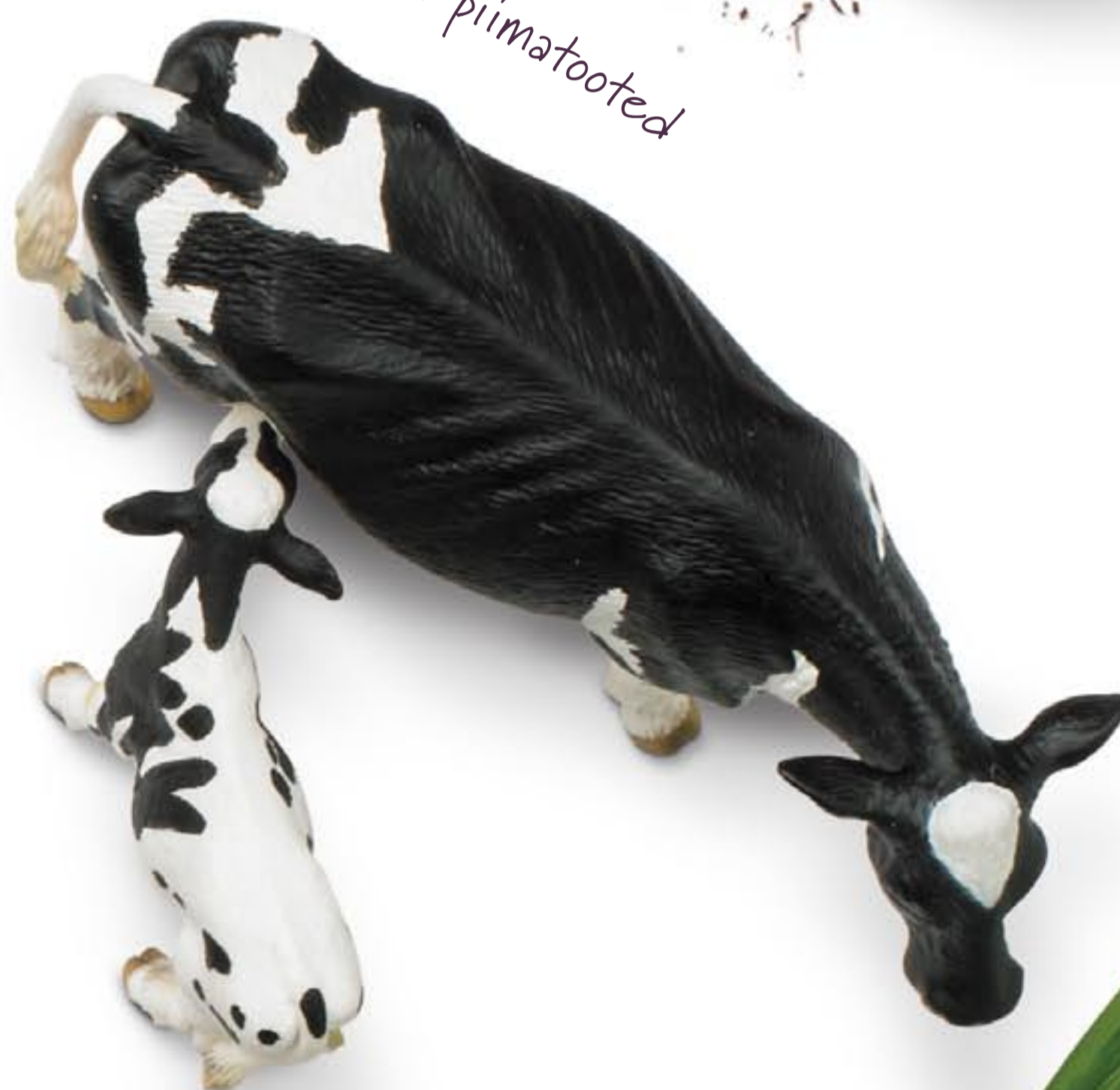
Midagi muud kui piimatooted