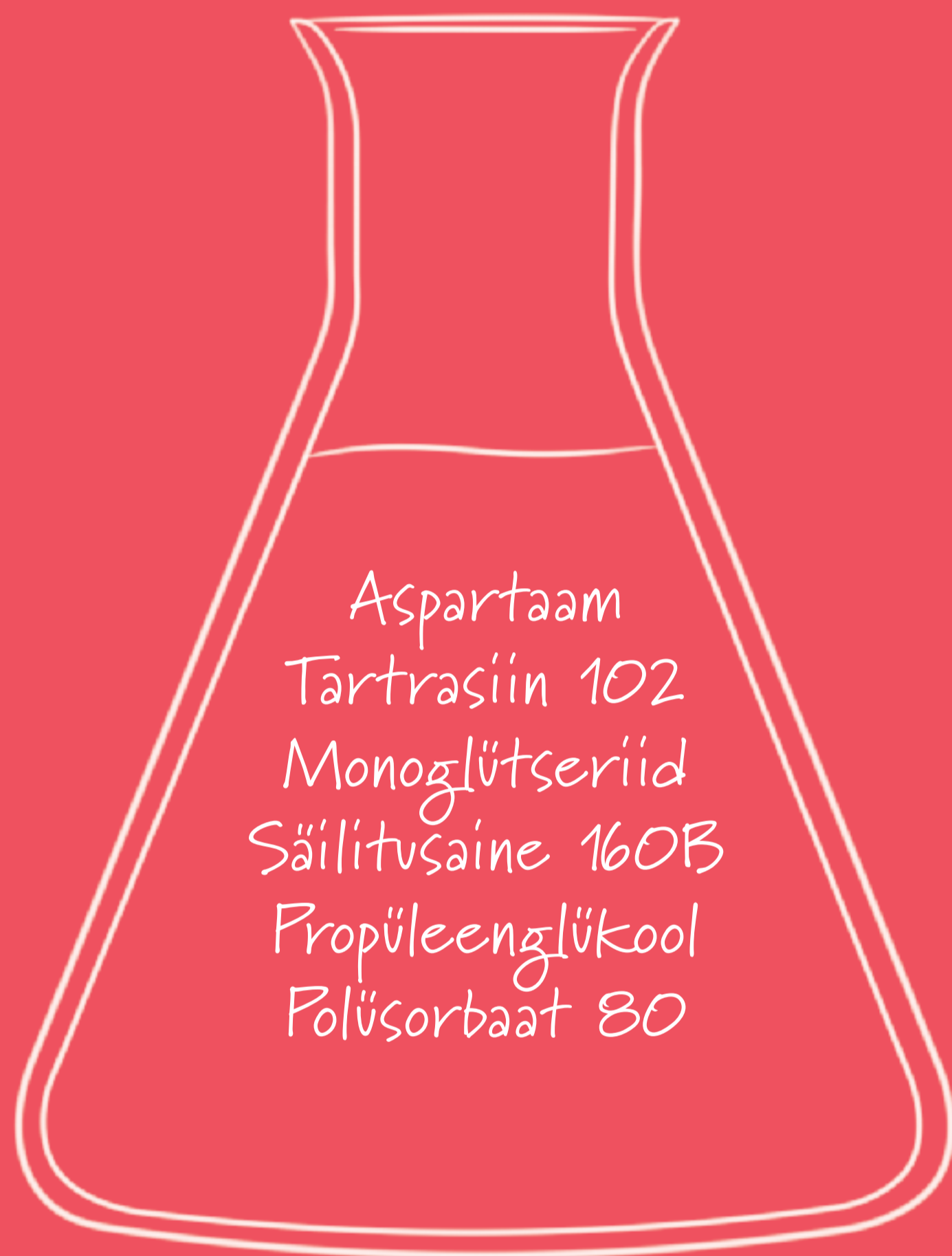
Kemikaalid ja lisaained