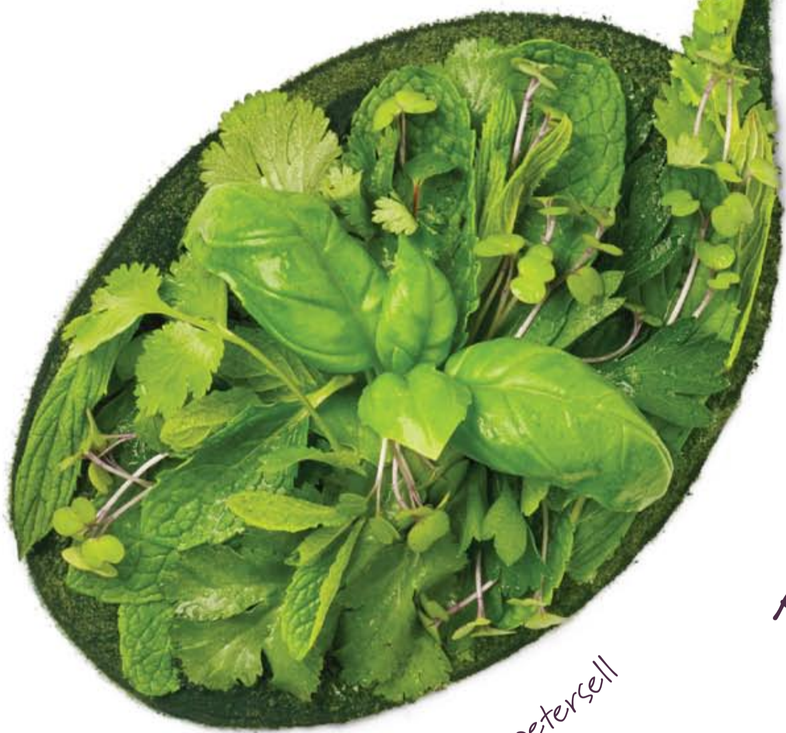
Münt, koriander, basiilik ja petersell