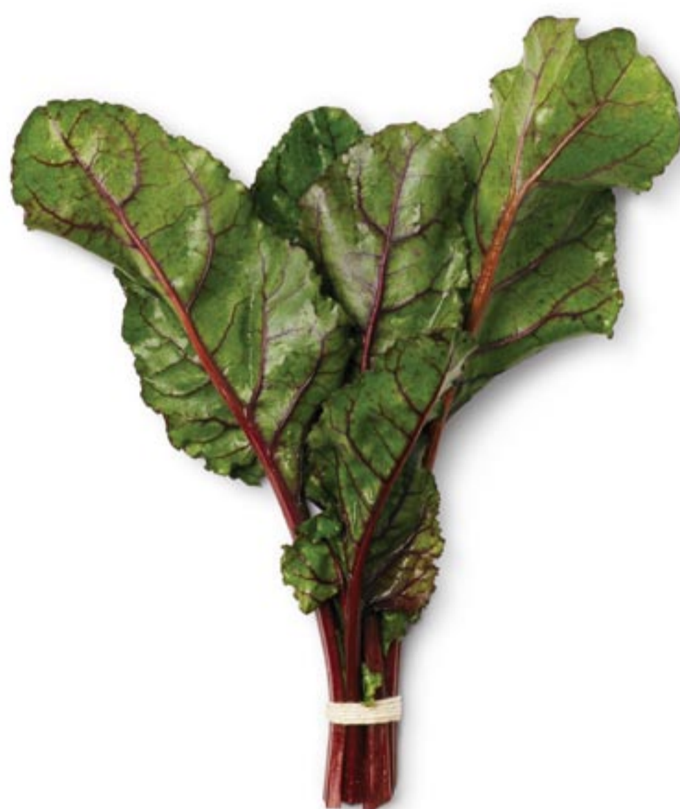
Peedi rohelised lehed