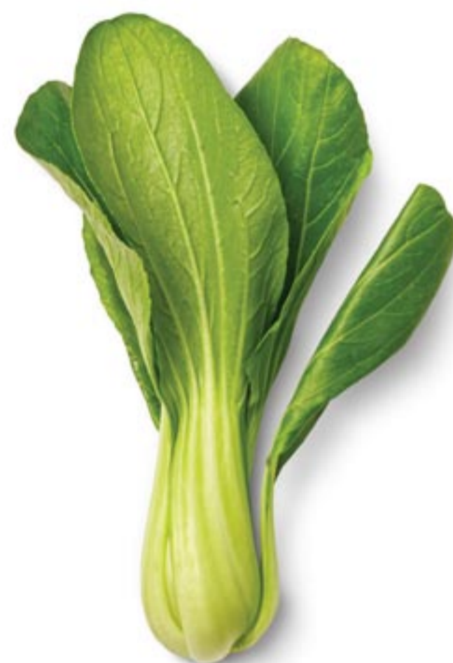
Bok choy kapsas