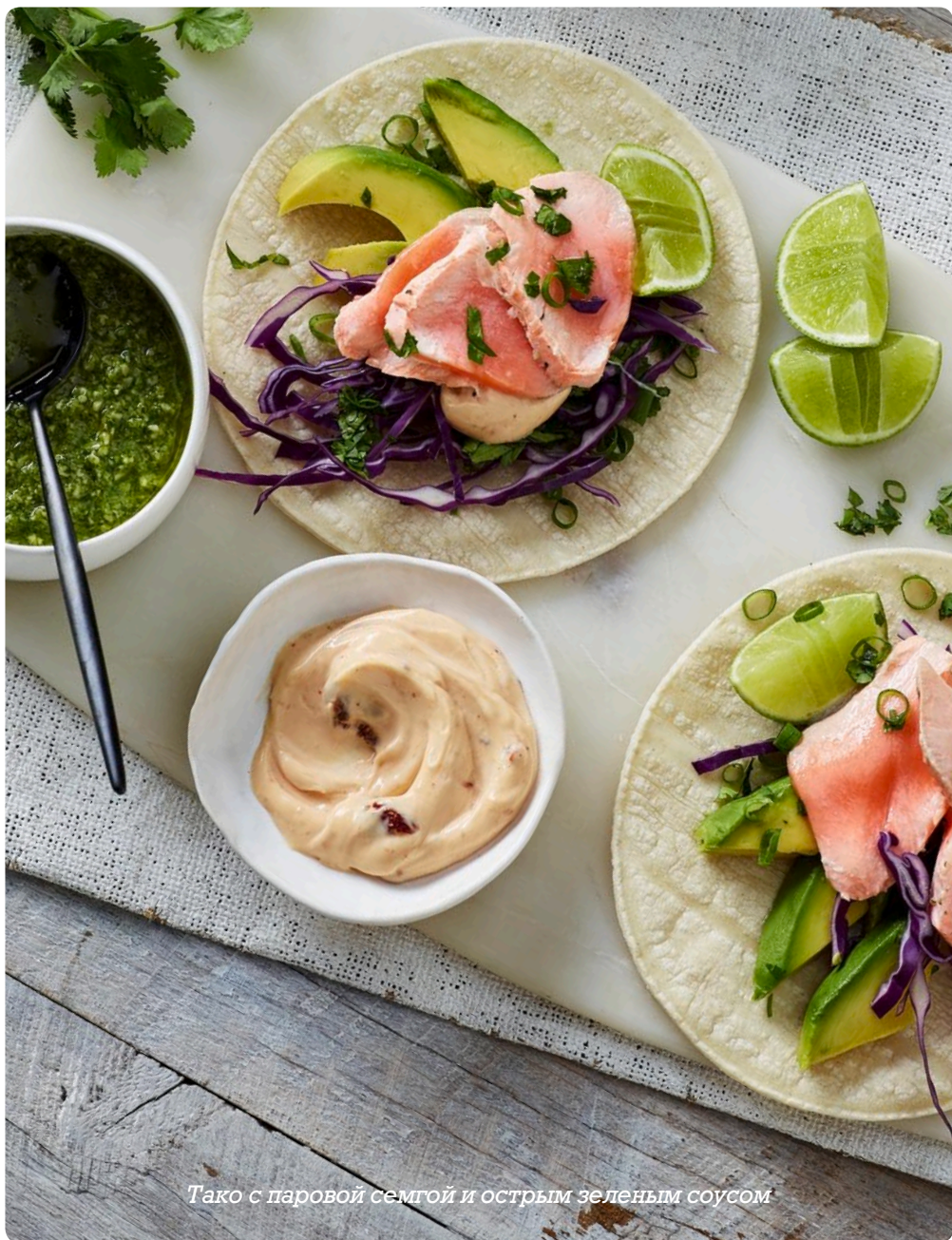
Тако с паровой семгой и острым зеленым соусом