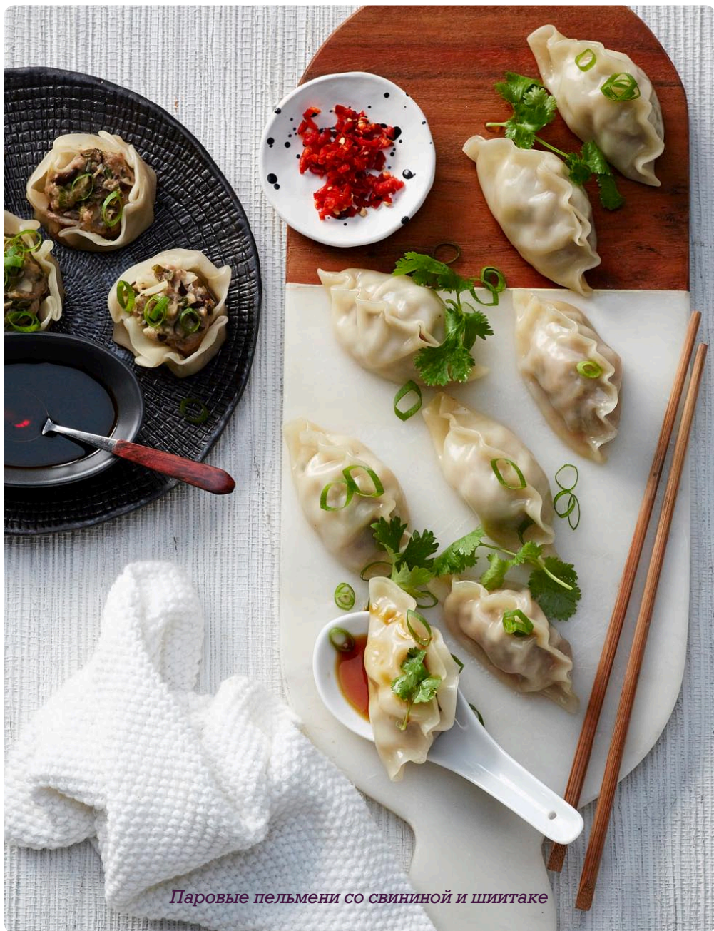
Паровые пельмени со свиной и шиитаке