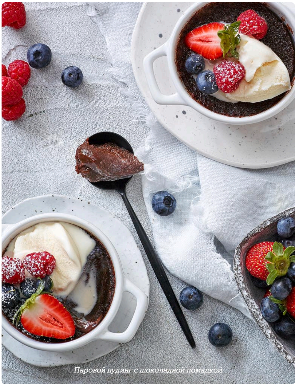
Паровой пудинг с шоколадной помадкой