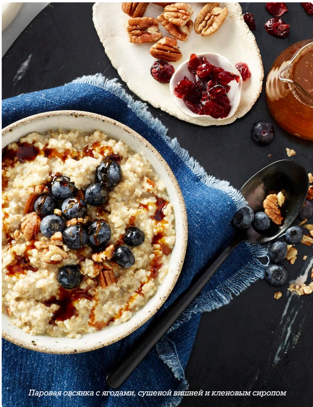
Паровая овсянка с ягодами, сушеной вишней и кленовым сиропом