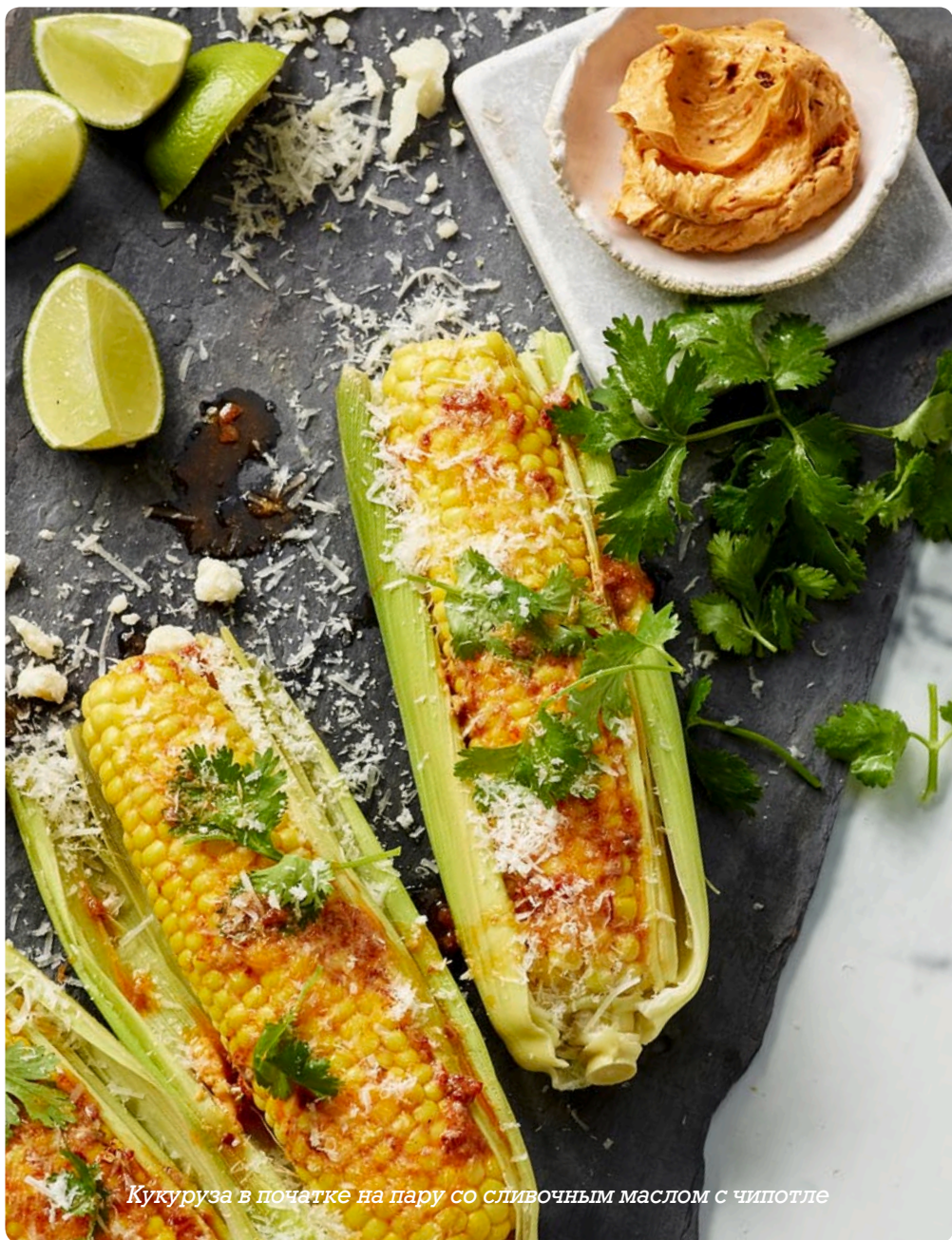
Кукуруза в початке на пару со сливочным маслом с чипотле