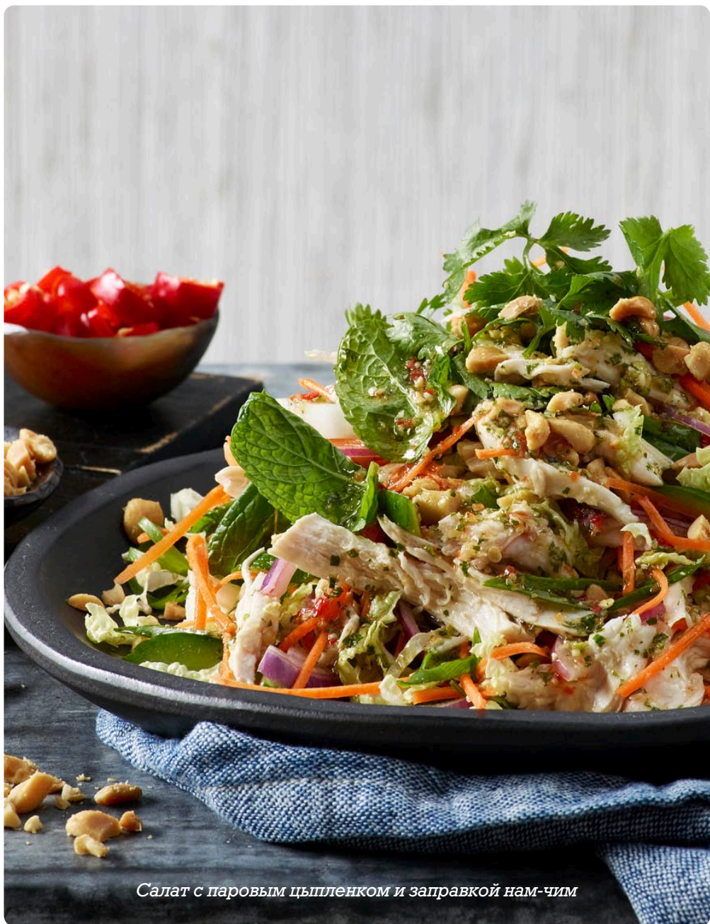
Салат с паровым цыпленком и заправкой нам-чим