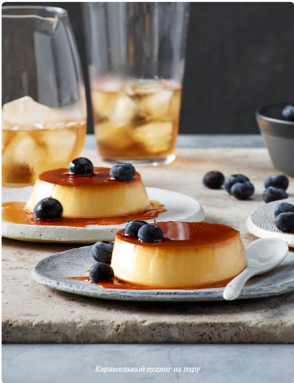
Карамельный пудинг на пару