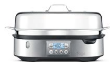
the Steam Zone™