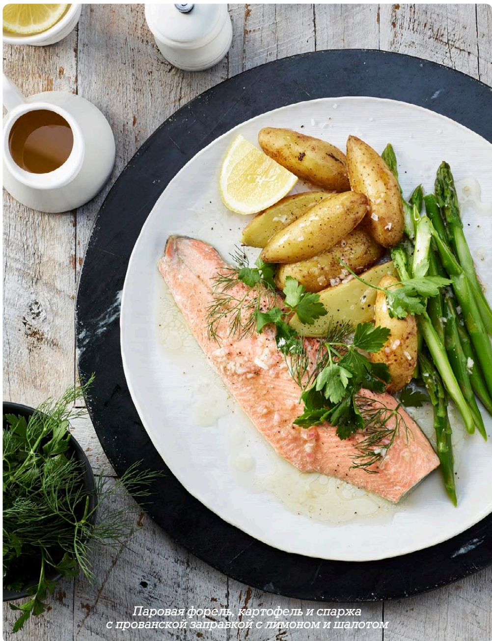
Паровая форель, картофель и спаржа с прованской заправкой с лимоном и шалотом