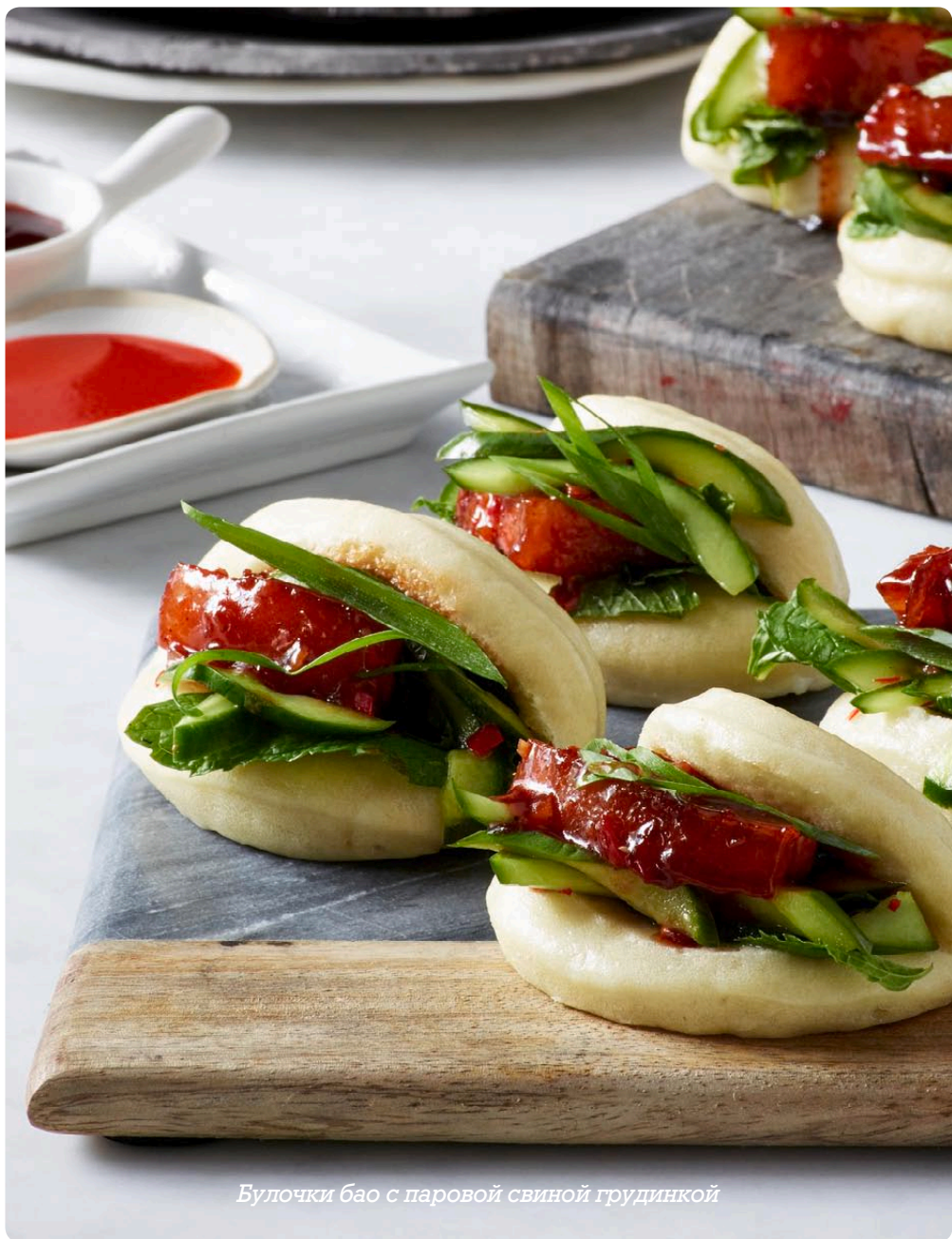
Булочки бао с паровой свиной грудинкой